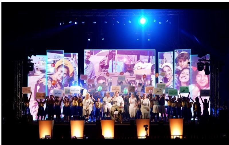
חגיגת יום העצמאות.