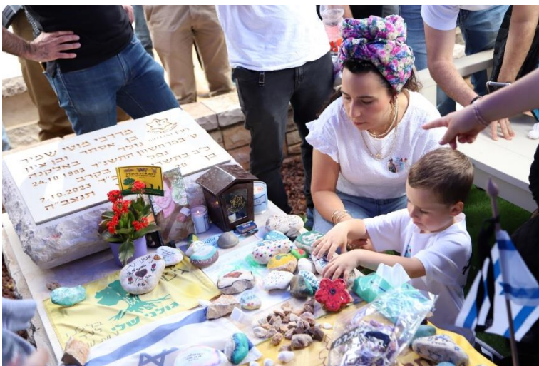
יום הזיכרון בבית הקברות באלקנה