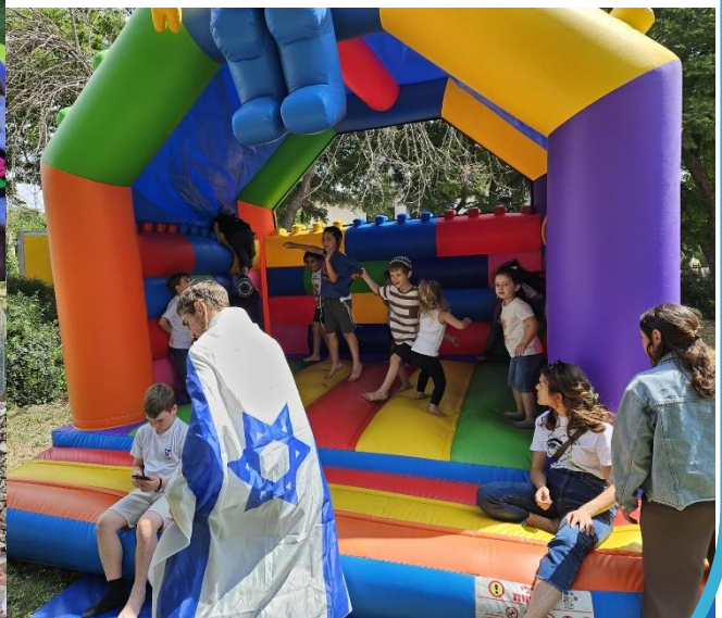
הפנינג יום העצמאות