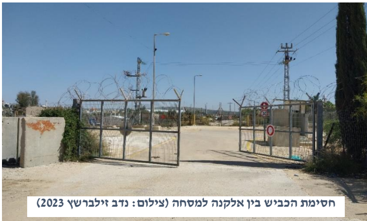
חסימת הכביש בין אלקנה למסחה (צילום: נדב זילברשץ 2023)

מטיילי השבת שבינינו, בעברם ליד 'מתחם רייק' או בדרכם ל'פארק הגורן', וודאי יבחינו בנוף המוזר: כביש אספלט חסום בשתי גדרות תיל ושערי ברזל, כשבתוך בית בודד מוקף עצי פרי. לעיתים חונה אוטובוס ליד השער ונוסעיו שמים פעמיהם לאותו הבית. מהו סיפורה של הגדר המזרחית של אלקנה?