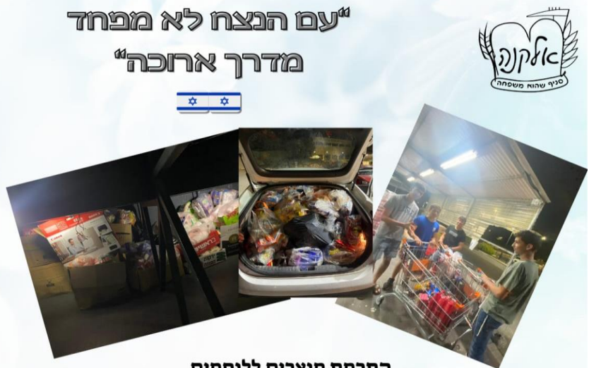
התרמת מוצרים ללוחמים