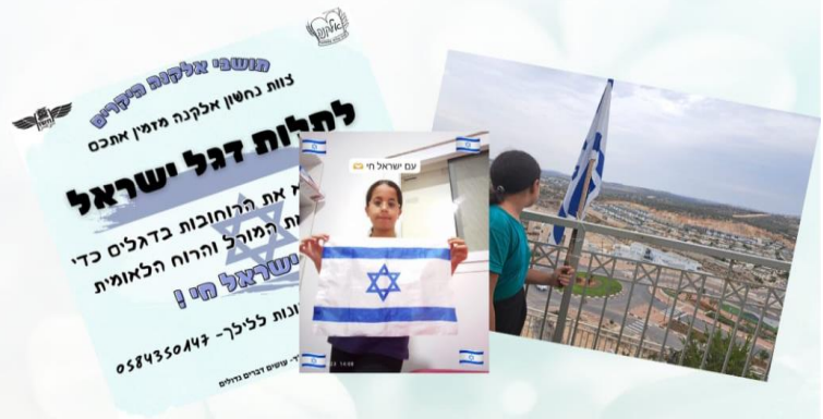
פרוייקט מניפים את הדגל