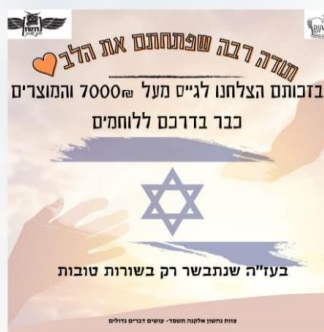
גיוס מעל 7000 שקל לקניית מוצרים בסיסיים לחיילים