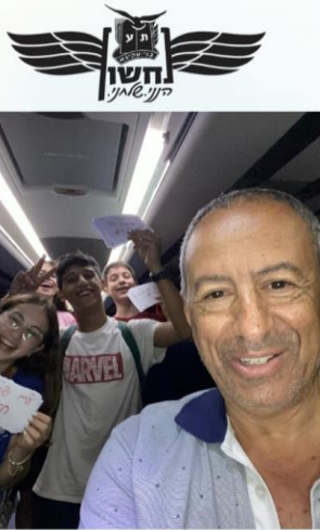
כתיבת מכתבים ללוחמים