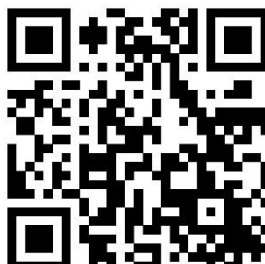
התפתחות חברתית בגיל הרך