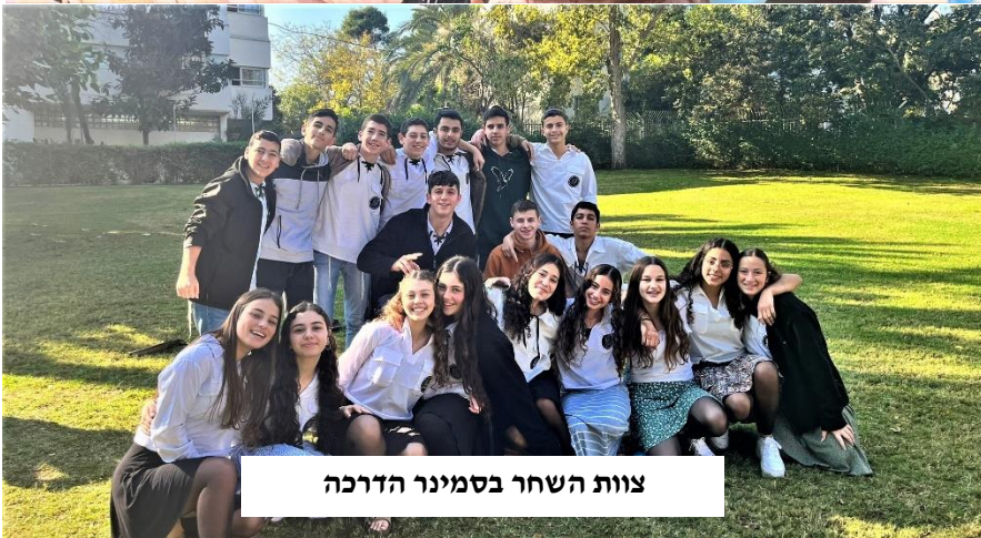
צוות השחר בסמינר הדרכה