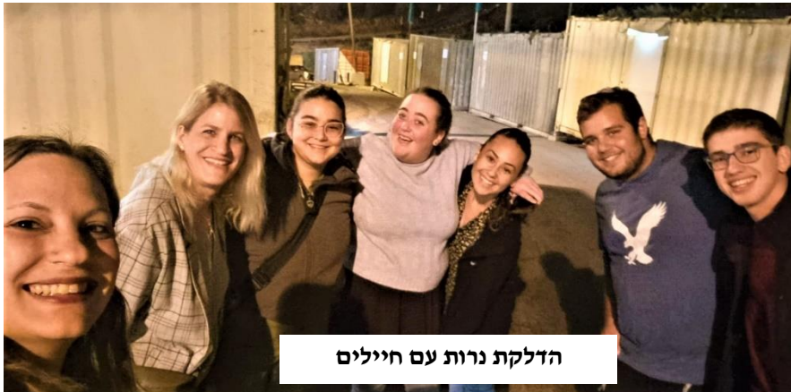
הדלקת נרות עם חיילים