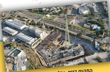
המקום כיום.

בהרכת שנה טובה ומתוקה מונית צילום ושאליה צוקן אנהלות הארכיון הביטאני לתולדות אלקנה