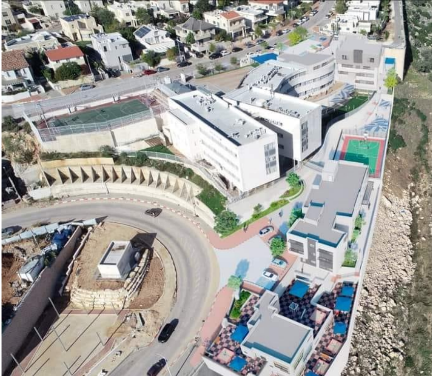
הדמיית קרית החינוך הצפונית החדשה

← אשכול ארבעת גני הילדים החדש שיהיו מוכנים בעז"ה לשנת הלימודים הבאה תשפ"ג הנו חלק מפרויקט גדול של הקמת קריית החינוך הצפונית, בסך כ-25 מיליון ש"ח, שגייסה המועצה ממשרד החינוך.