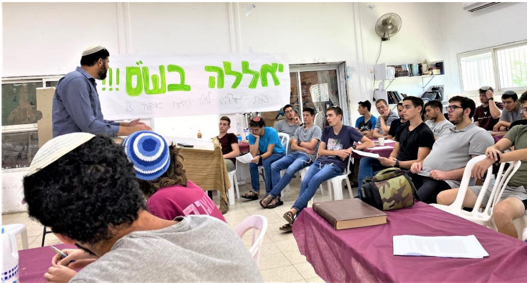
בית מדרש לנוער

הסיום הגדול של השבועיים האלה יהיה במוצ"ש, בו כיתות ט'-י"ב ייצאו לסיור בירושלים עם תפילה בכותל ושירי התעוררות ותפילה. תודה רבה ליחידת ההתנדבות ולמחלקה לשירותים חברתיים על שיתוף הפעולה. שנזכה להמשיך להפיץ את האור ולעשות טוב. שבת שלום לכולם. יחידת הנוער.