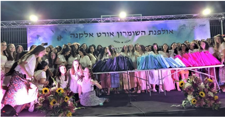
מסיבת סיום אולפנה