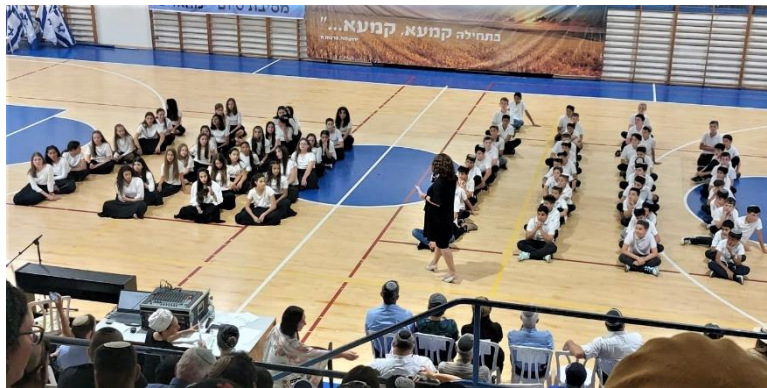
מסיבת סיום בי"ס כרמים

נמשיך להשקיע בעז"ה עוד ועוד בחינוך ילדינו, נצייד את ילדינו במיטב הכלים ונכין אותם כבר היום לאתגרי המחר. כי הרי מה יותר חשוב מחינוך? בוגרי י"ב היקרים באולפנה ובישיבה – בהצלחה בהמשך הדרך במסגרות שבחרתם, במדרשות ובמכונות, בצה"ל, בישיבות הגבוהות וההסדר. אין לנו ספק שבזכות החינוך שקיבלתם בבית ובמוסדות החינוך תובילו ותעשו חיל בכל מקום! ודבר אחרון ומבחינתי המסר הכי חשוב לילדים ולהורים: הקיץ, החופש והכיף מזמינים אלינו גם אתגרים רבים ובמיוחד בנושא של זהירות בדרכים. ילדים, קחו עוד דקה ותשומת לב לפני שאתם עוברים את הכביש! היזהרו עם האופניים וקורקינטים והימנעו מלרדת לכבישים! ואנחנו ההורים, נוריד קצת רגל מהגז, נחפש את הילדים במעברי החציה וניתן להם לעבור, נחגור את המשפחה בחגורות בטיחות. כי כולנו בעז"ה רוצים לחזור שמחים ומאושרים ולפתוח את שנת הלימודים ברגל ימין.