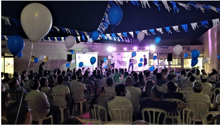
מסיבת סיום ימ"ה