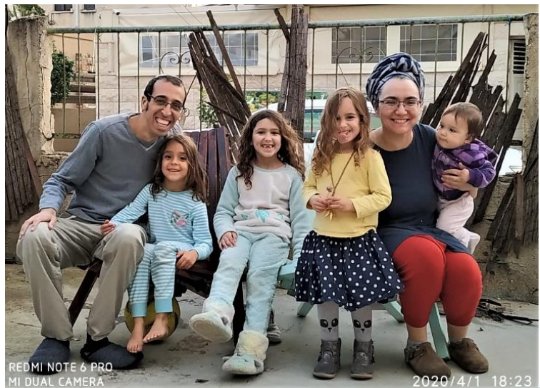
REDMI NOTE 6 PRO MI DUAL CAMERA