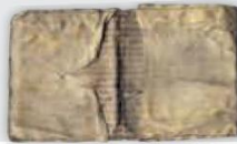
ארנק התורה